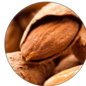
Масло сладкого миндаля